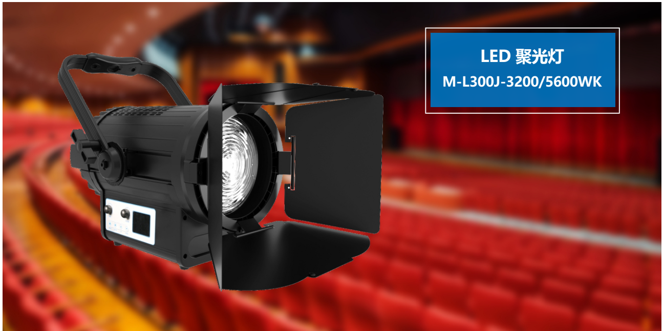
LED 聚光灯 M-L300J-3200/5600WK