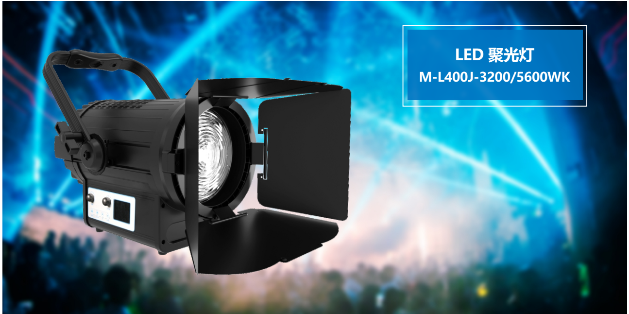
LED 聚光灯 M-L400J-3200/5600WK